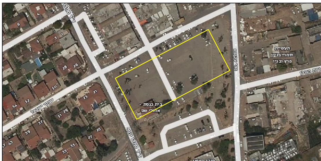
איור 1: תרשים סביבה, תיאור אזור הפרויקט

במסגרת פרויקט שדרוג שוק ישן בעיר נתיבות מתוכנת הקמת חניון תת קרקע ושלושה מבנים בעלי 1-2 קומות מעליו הפרויקט ממוקם החלק המזרחי של העיר נתיבות, בין רח' רבי עקיבא לרח' ד"ר סמלו יוסף (ראה תרשים סביבה באיור 1). הדוח שלהלן הינו דוח ראשוני המתבסס על סקיצות אדריכליות בלבד. בהתאם, עוסק הדוח בסקירת חתך הקרקע של באתר הנדון ובהמלצות ראשוניות לתכנון לביסוס.