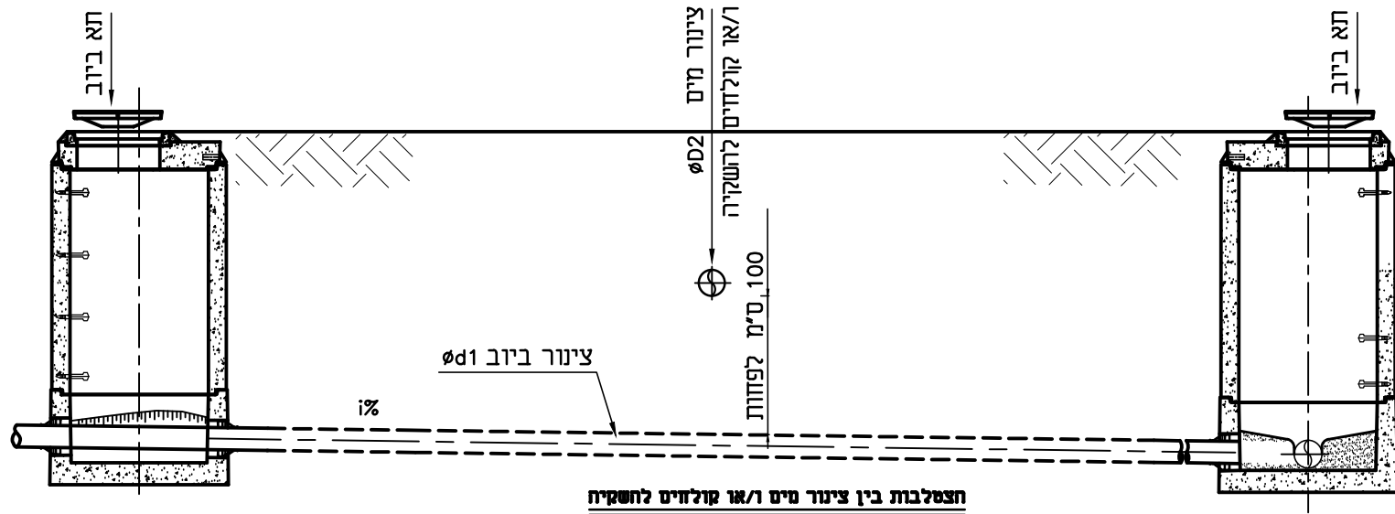
הצטלבות בין צינור מים ו/או קולחים להשקיה לבין צינור ביוב גרביסציוני ללא שרוול